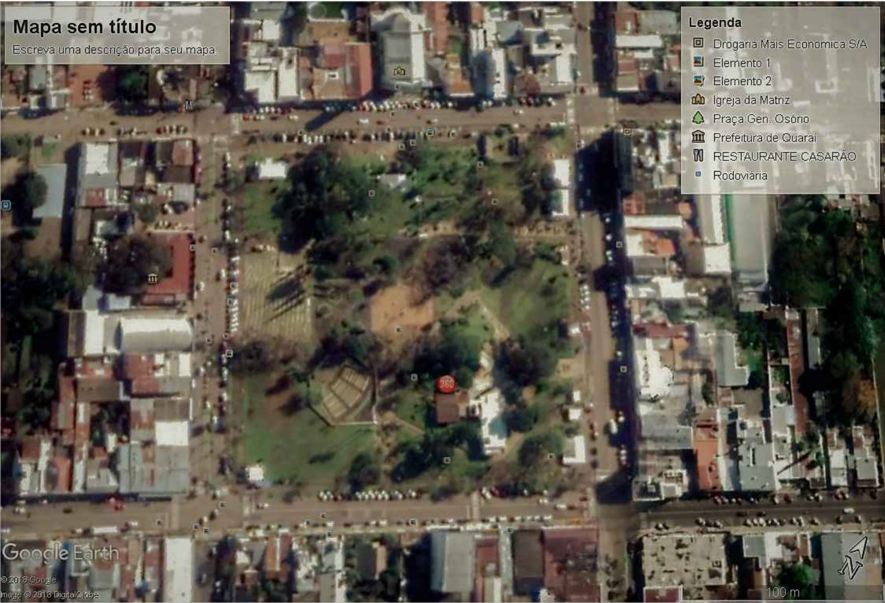
VISTA AÉREA DIURNA