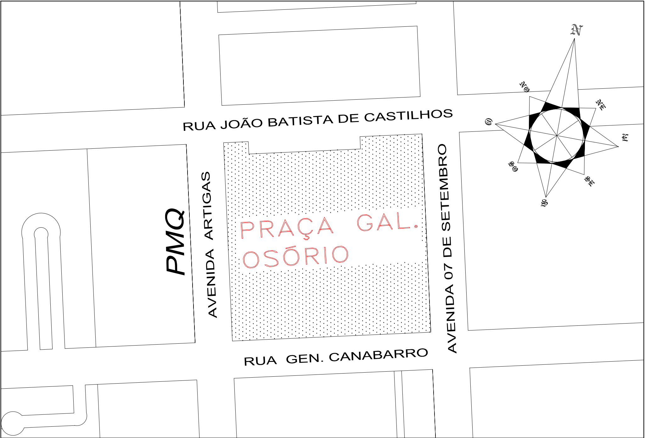
Planta de Situação S/escala